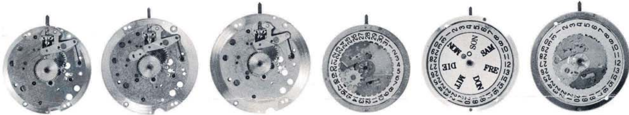
10 1/2 1013 sans sec. avec seconde

10 1/2 1013 11 1/2 1113 12 1213 13 1/2 1313 18000 oscillations