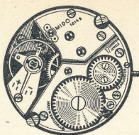
10½''' - 1014 B seconde habituelle small second