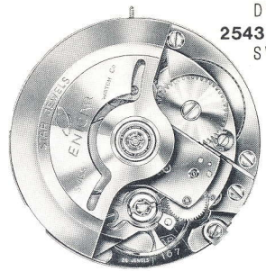
Cal. 165, 166, 167