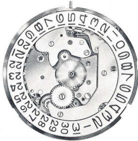
Cal. 161, 165