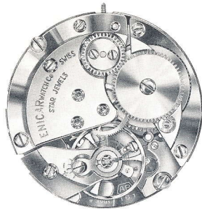
Cal. 160, 161, 163